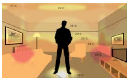
Rozloženie teplôt pri použití tradičného vykurovacieho systému s radiátormi. Veľké rozdiely teplôt v miestnosti (18 – 65°C).

Tradičné nástenné vykurovacie telesá ohrievajú vzduch vo svojom najbližšom okolí, ktorý následne stúpa ku stropu. Podlahové kúrenie Raychem zaisťuje rovnomerné šírenie tepla v celej miestnosti, pričom najteplejšia zóna sa nachádza presne tam, kde je to potrebné.